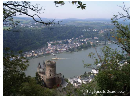
Layout, Redaktion, Fotos: www.loreleyinfo.de

im UNESCO Welterbe Oberes Mittelrheintal