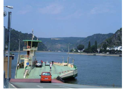
Fähre Loreley VI in St. Goar

Die Bürger Initiative Rheinpassagen setzt sich für verbesserte Rheinquerungen im Welterbe Oberes Mittelrheintal ein.